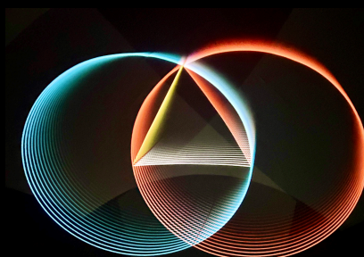
« Euclide Etude »