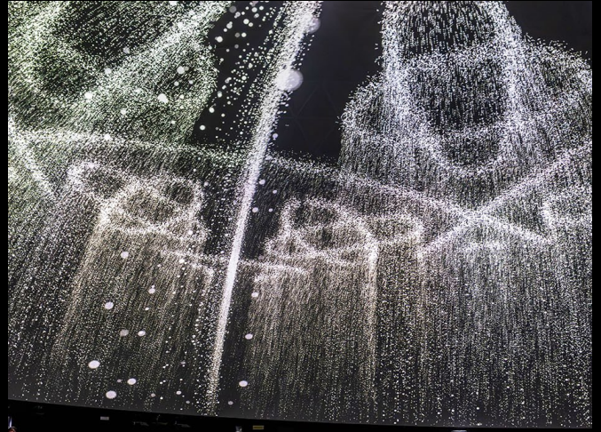
« Chladni Plate »