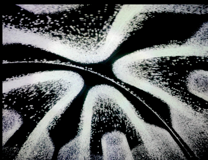
« Chladni Plate »