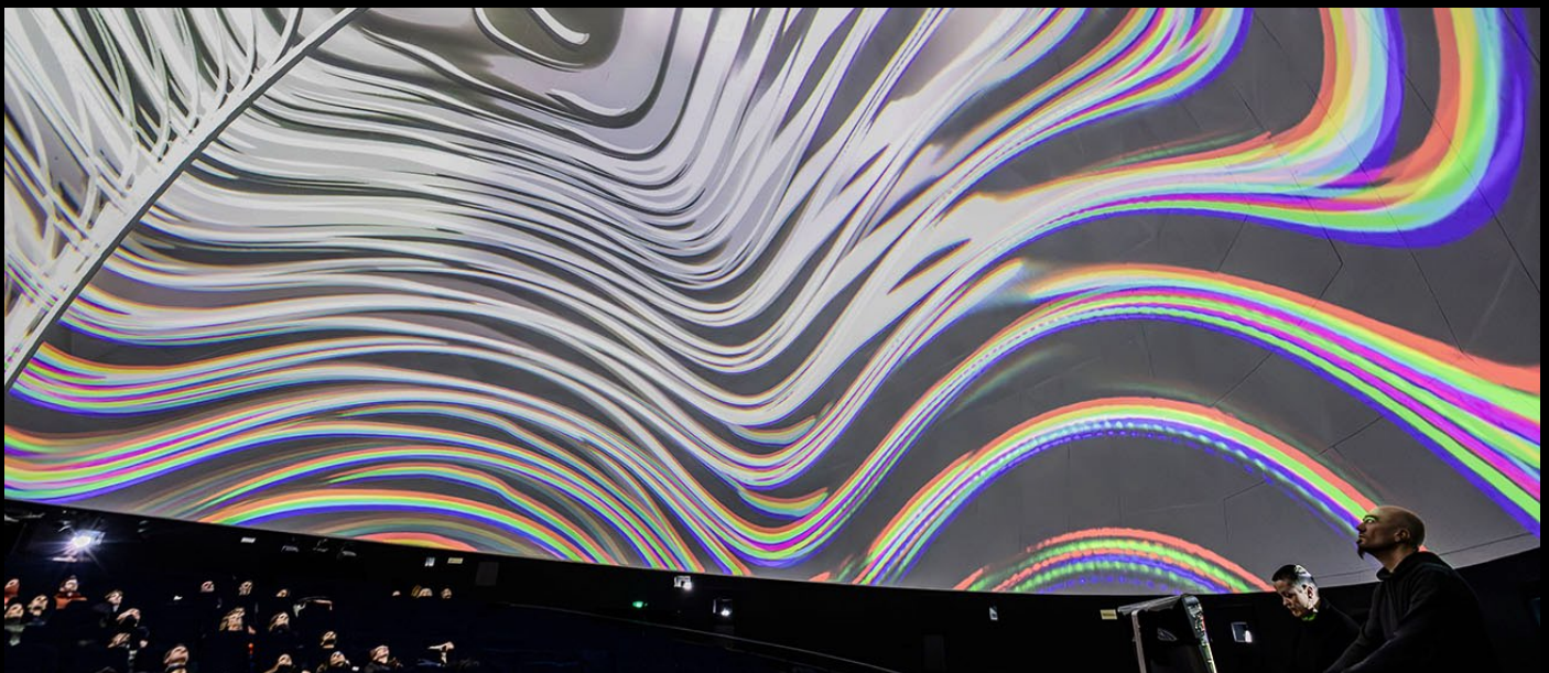
« Variations sur Fibonacci »