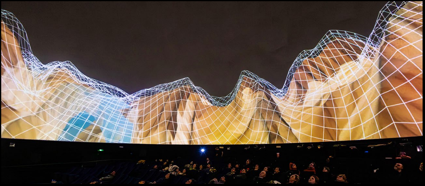
« Fourier »